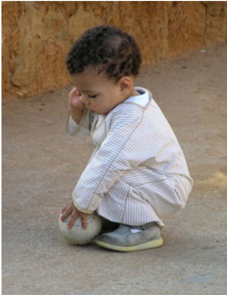
Bambino con djellaba, Rabat

In der Hauptstadt Rabat , 95km entfernt, kann man die interessante und bunte Kashba der Oudaya besichtigen, weiterhin andalusische Gärten und das Mausoleum von Mohamed V (der umstrittene Vater des aktuellen Königs). Viele Touristen waren marokkanisch und ich fotografierte einige sehr hübsche Kinder mit ihren Kleinen Djellabas.